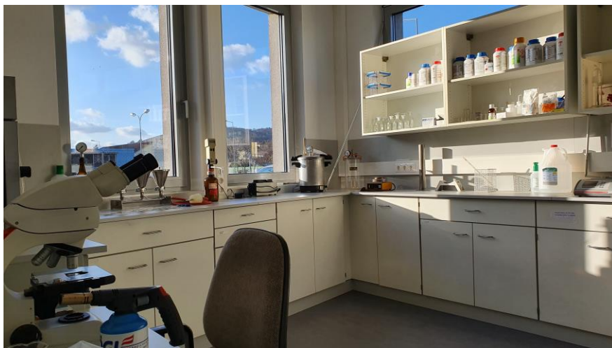
Eins der Praktikumlabor