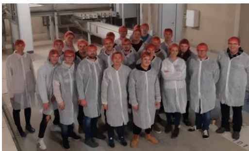
Links: Weitere Exkursion des 1. LG