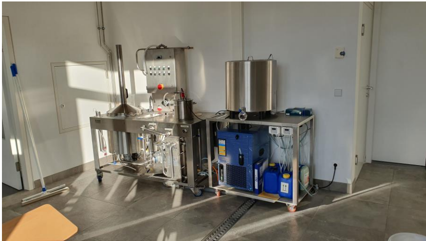
Der neue Standplatz der Lehrbrauerei