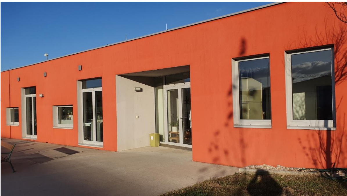
Das neue ÖGI - Gebäude

Nach einem Kraftakt aller Beteiligten konnte der Unterricht des 1. Lehrgangs pünktlich am 02.10.2019 aufgenommen werden. Die neue Berufsschule besteht aus einem modernen Lehrsaal, der Lehrbrauerei mit Fruchtsaft- und Getränkeherstellung, 2 Praktikumlabor, 2 Büros, einem Lehrerzimmer und den üblichen Nebenräumen.