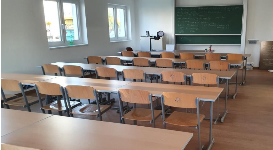
Der neue Klassenraum mit 30 Sitzplätzen